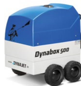
Dynabox 500 12 V DC or 1x 230 V / 50 Hz